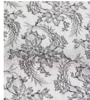
Solstiss - Caudry

Pour les « consommateurs », que sont les stylistes, les créateurs et le client final, l'IG de la dentelle de Calais-Caudry est une garantie d'origine, une authentification, et donc une garantie de qualité exceptionnelle . En achetant cette dentelle précieuse, les clients des dentelliers pourront être fiers de contribuer au maintien de métiers rares, et de garantir l'élégance de la mode de demain.