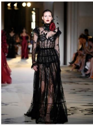
Beauvillain Davoine SAS / Ph : Giovanni Giannoni Getty Images

Depuis des dizaines d'années, à chaque saison, la dentelle de Calais-Caudry fait rayonner notre savoir-faire régional à l'international , en habillant de délicatesse et d'élégance les mannequins lors des défilés haute-couture dans le monde entier...Aujourd'hui, la reconnaissance officielle par cette IG est une nouvelle occasion pour les habitants des Hauts de France d'être fiers, de découvrir, ou redécouvrir, cette envoûtante et fascinante dentelle de Calais-Caudry.